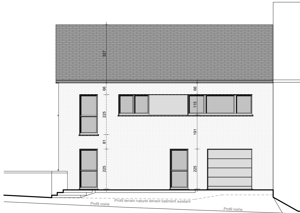
AP02 - Façade AVANT éch. : 1/100